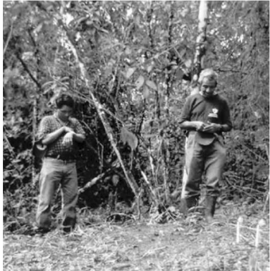
Durante la búsqueda de las niñas

Muchos niños se quedaban huérfanos. Se logran cosas cuando uno está organizado”