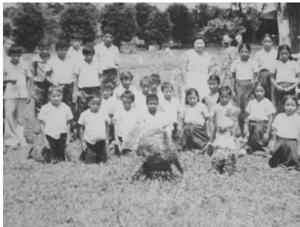
Niños y niñas, antes de la Masacre de las Dos Erres, celebrando en su escuela el 15 de septiembre.

Si bien estos delitos fueron cometidos en contra de todas las personas, tenían un especial efecto en la niñez y juventud. También es de tener en cuenta que por cada persona adulta que fue asesinada, secuestrada, desaparecida, torturada o cualquiera de los otros delitos, probablemente existía un menor que dependiera directamente de él o ella, por lo que a su condición de víctimas se les agrega la vulnerabilidad.