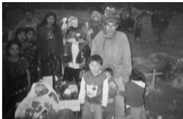
Una familia de la comunidad en el cementerio

“Aún hoy tengo miedo de contar lo que sé, porque es posible que haya gente que pueda usar lo que contemos... No estoy muy segura de poder hablar con confianza porque talvez no pensamos igual... Hemos resistido tantos años, porque hemos sabido callar” ... 34