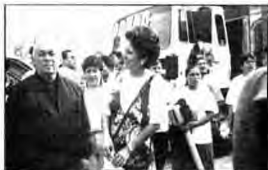
1 de octubre 1997. Día del Niño.

Desde 1,990 la Procuraduría de los Derechos Humanos creó la figura de la Defensoría de los Derechos de la Niñez. Esta tiene como funciones primordiales la protección de los Derechos Humanos de la Niñez y la Juventud establecidos en la Constitución Política de la República, los tratados y convenios internacionales aceptados y ratificados por Guatemala, la Declaración Universal de los Derechos Humanos, la Convención sobre los Derechos del Niño y otras disposiciones legales vigentes.