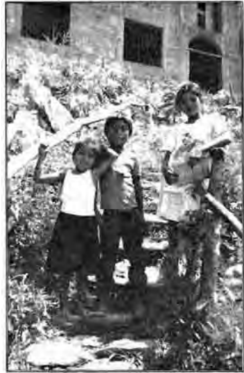
Niñas y niños de Fray Bartolome de las Casas, Coban Alta Verapaz.

La mayoría de niñas, niños y adolescentes en Guatemala viven constantemente amenazados por la pobreza, la marginación y la violencia en general. Puede decirse que aquellos que tienen acceso a los servicios de salud, educación, a la protección y a la participación son privilegiados. Pese a ello, no están exentos de sufrir amenazas contra su seguridad e incluso contra su vida. La mejor prueba de ello son los constantes secuestros de que ha sido víctima la niñez y la juventud, en manos de bandas de delincuentes que se amparan en la impunidad generada por la ineficiencia del Ministerio Público y los Tribunales de Justicia. Así como por la incapacidad del gobierno de implementar integralmente una política criminal que prevenga y disuada entre otros muchos esta clase de delitos.