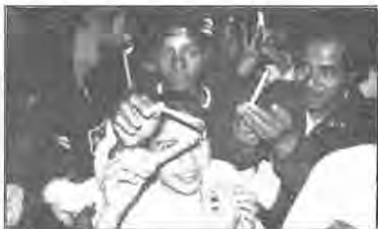
Festival cultural de la Niñez, Foto por Mario Díaz.

También se ha argumentado, sin consistencia, algunas supuestas inconstitucionalidades de esta ley, pero ello no puede determinar, por la vía del recurso pertinente, una posición sólida que lo contraríe.