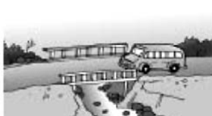
Puentes y carreteras