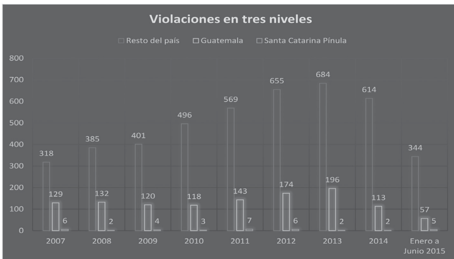
Gráfica 6 20